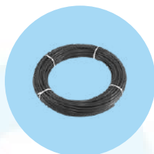
Tube haute pression