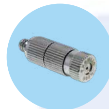
Buse haute pression