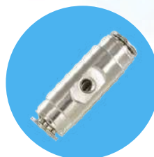
Raccord de brumisation