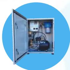
Coffret de brumisation